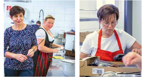
Die gesamte Bilderreihe finden Sie unter pischelsdorf.graz-seckau.at .