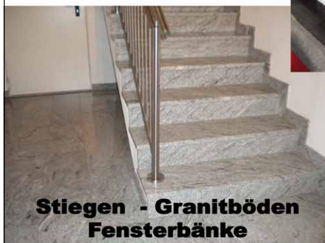
Stiegen - Granitböden Fensterbänke