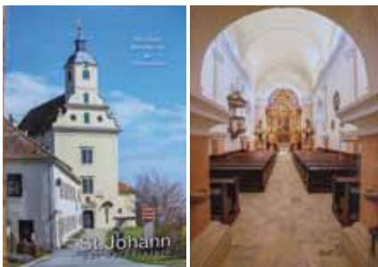
Ansichten vom neuen Kirchenführer.